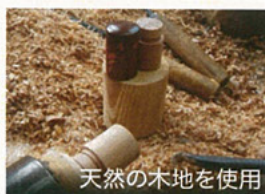
天然の木地を使用