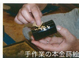
手作業の本金蒔絵

ふれた時に感じる本漆のあたたかく、やさしい質感は、 大きな安心感を与えてくれます。