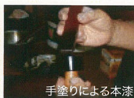
手塗りによる本漆