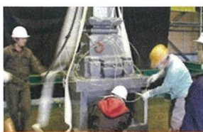
実験動画をご覧いただけます

阪神大震災や新潟中越地震などの 再現テストを行ない、 基礎的な実験から実物大の 大型墓石まで実証しています。